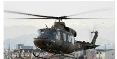
多用途ヘリコプター（UH-2）