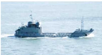
小型級船舶（イメージ）