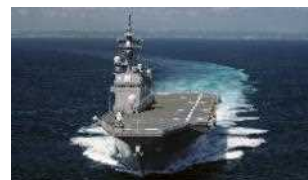
「ひゅうが」型護衛艦