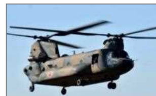
輸送ヘリコプター (CH-47J/JA)